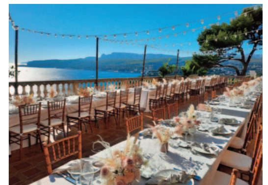
RÉCEPTION / HYÈRES (83)