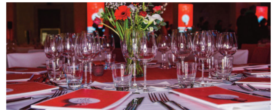
← DÎNER DE GALA DE LA CROIX-ROUGE / MARSEILLE (13)