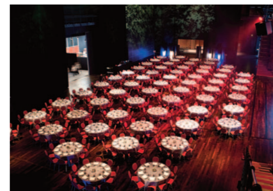
CONGRÈS / LYON (69)