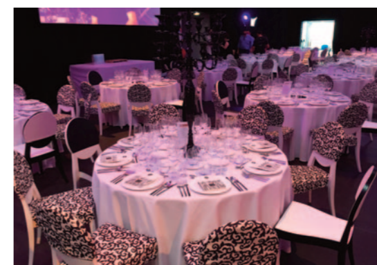
TOQUES ET CLOCHERS / LIMOUX (11)