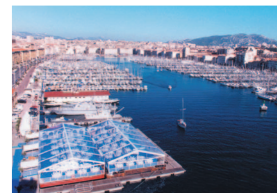
RÉCEPTION SOUS TENTES / VIEUX PORT - MARSEILLE (13)