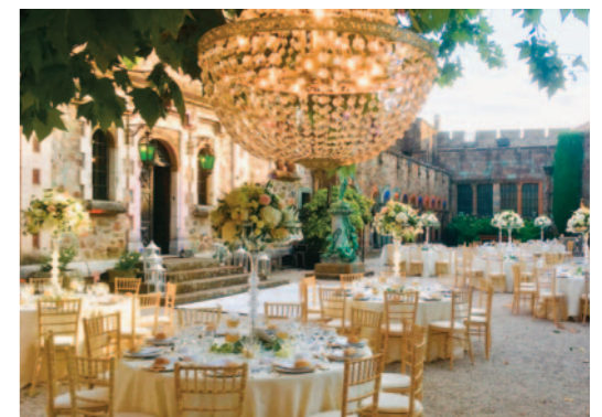
RÉCEPTION / CHÂTEAU DE LA NAPOULE (06)