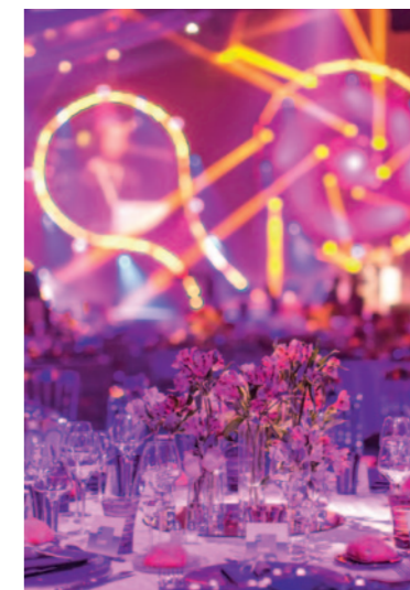
← DÎNER DE GALA TAX FREE / CANNES (06)