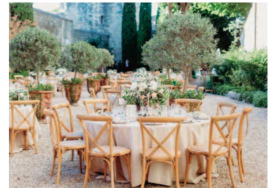
RÉCEPTION / CHÂTEAU D'UZÈS (30)