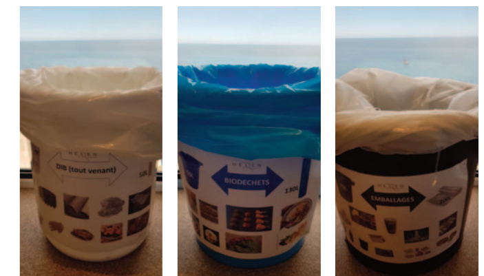
RECYCLAGE DES DÉCHETS SUR RÉCEPTION 1